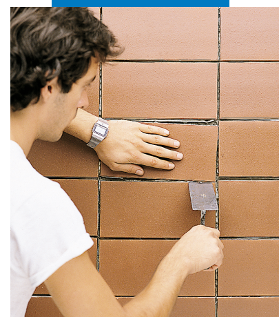
Время корректировки плитки – до 60 минут