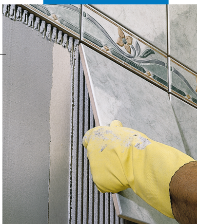
Укладка плитки ординарного обжига в качестве стенового покрытия поверх гипсовых панелей