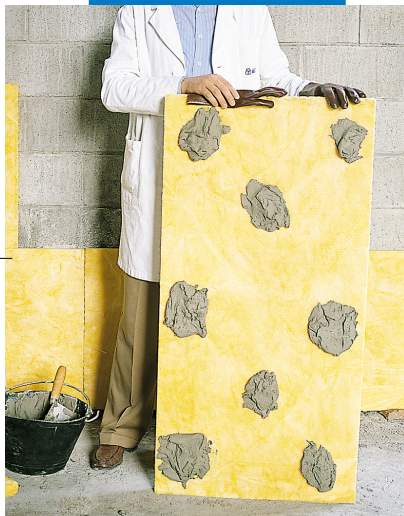
Клеевое крепление изоляционных панелей на неотделанную стену