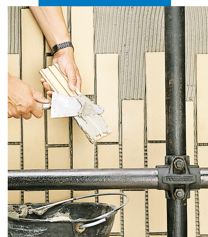
Укладка обшивки снаружи Прим.: Хорошо заполнять клеем заднюю поверхность обшивки