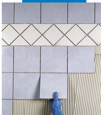
Укладка плитки ординарного обжига в качестве стенового покрытия в ванной поверх штукатурки